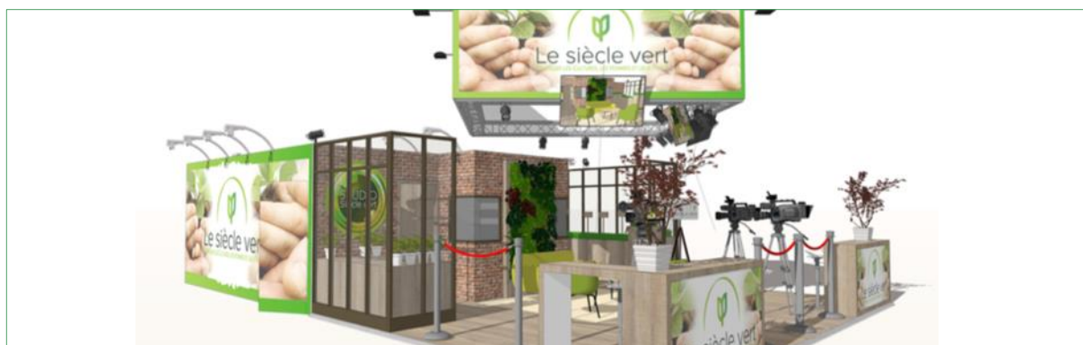
Paris Expo, Porte de Versailles, Pavillon 4 - Allée B - Stand N°4 B 056

Paris, le 31 janvier 2019 – L'Union des Industries de la Protection des Plantes (UIPP), sous la bannière « Siècle Vert », sera présent au Salon International de l'Agriculture 2019, du 23 février au 03 mars prochains. À l'occasion de ce rendez-vous incontournable, tous les acteurs de la protection des plantes s'engagent et prennent place dans le débat citoyen sur l'utilité et l'impact des produits phytosanitaires dans le quotidien des Français. Siècle Vert ouvre le débat national à l'occasion du salon avant d'aller ensuite à la rencontre des Français dans les territoires.